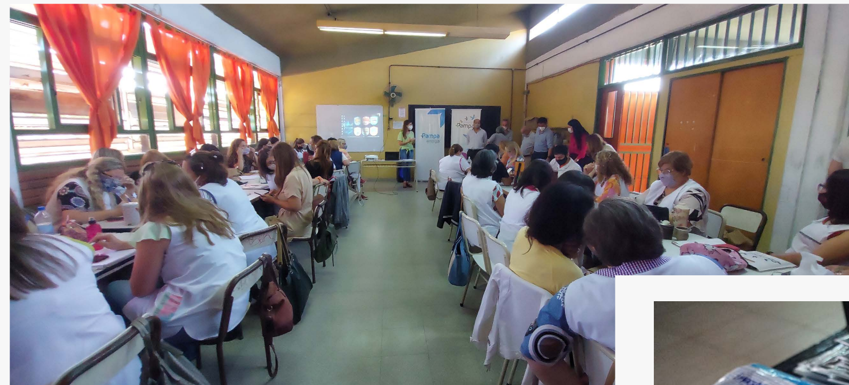
Entrega y presentación de la iniciativa en Zárate