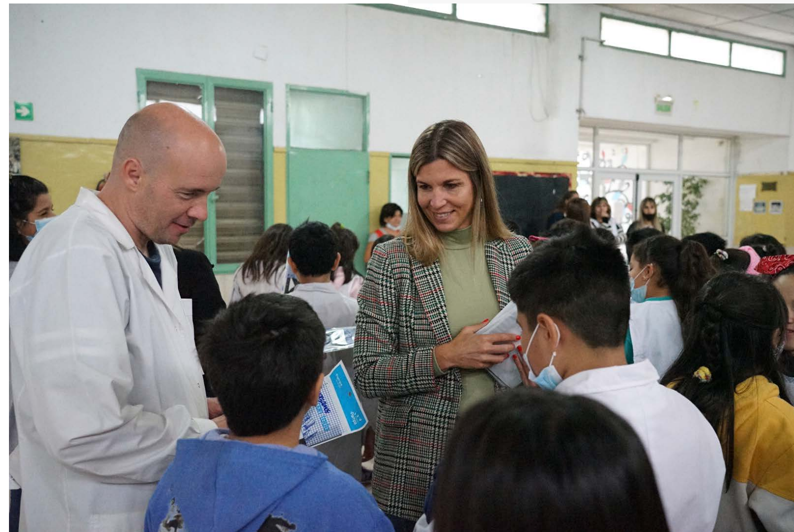
Entrega en Neuquén junto a docentes