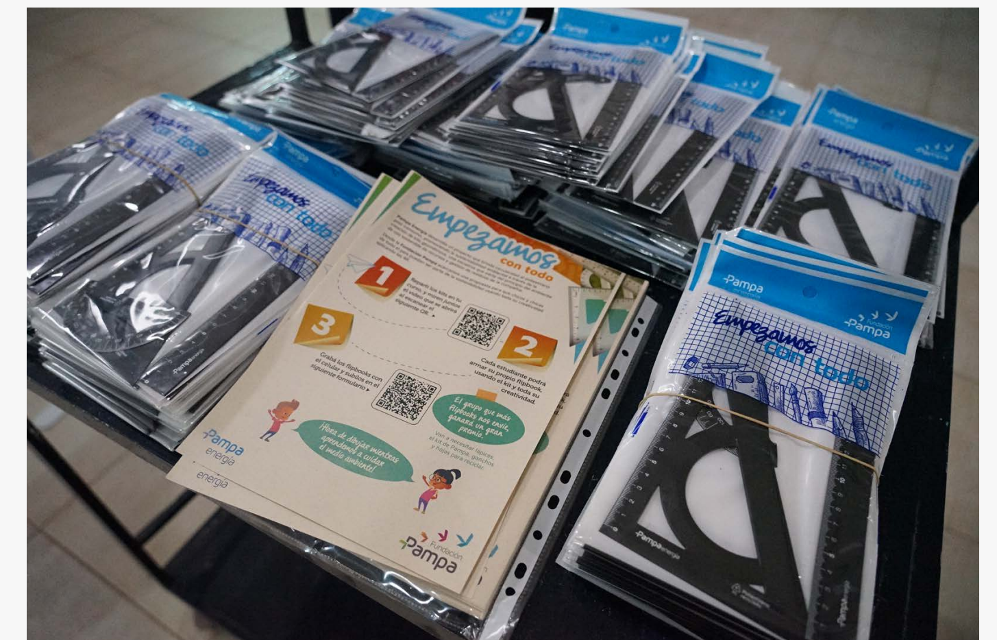
Kits geométricos y actividad para el aula